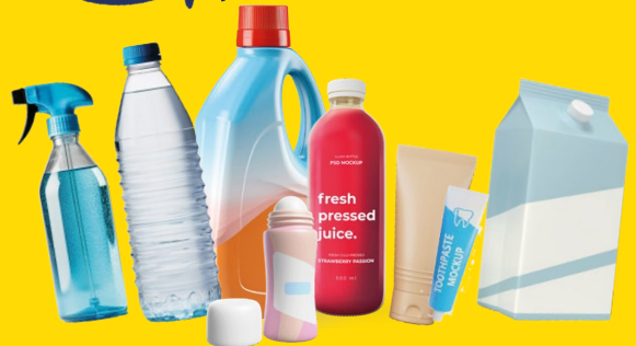
TOUTES LES BOUTEILLES, FLACONS ET BIDONS