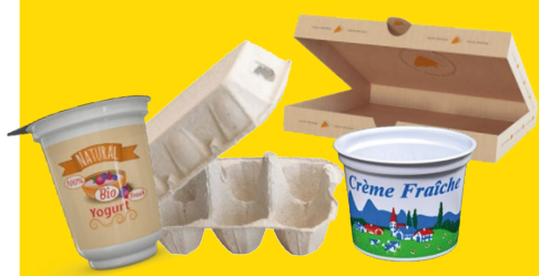
TOUS LES POTS ET BOÎTES