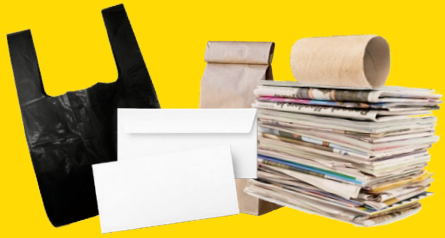
SACS, SACHETS ET PAPIERS