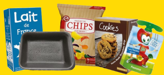
BARQUETTES ET PAQUETS