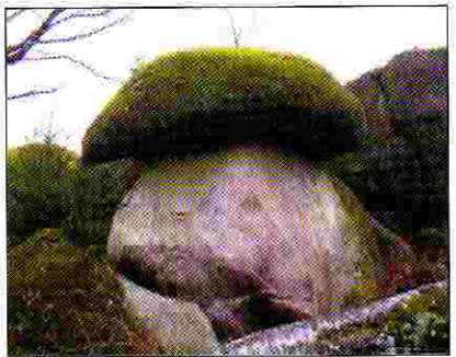
La pierre champignon.

montagne. Sous les frondaisons, on découvre les moraines de granit : menhirs, dolmens, pierre à cupules, pierres à sacrifices, pierres champignons, les rochers au fées, la roche branlante, autant de mégalithes porteurs de légendes. Entre le village de Villerajouze et Blond, se dressent les rochers de Puychaud, énormes blocs erratiques qui attirent depuis longtemps les curieux et marquent la limite entre langue d'oïl et langue d'oc. On peut y voir une plaque commémorative dont le texte en occitan rend hommage à Frédéric Mistral, écrivain provençal, fondateur du félibrige.