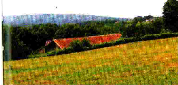
Les monts de Blond.