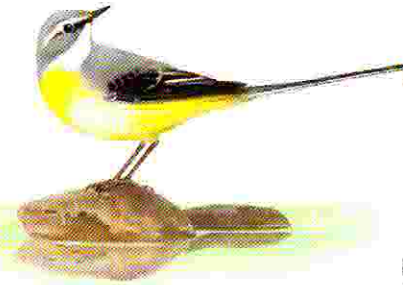
Bergeronnette des ruisseaux Dessin P. R.

1 Départ du gymnase. En sortant du parking, aller à gauche (attention, la Mandragore n'est pas loin !). Après 150 m, prendre à gauche le chemin de terre en face de l'étang. Traverser le ruisseau et continuer tout droit jusqu'à la route de L'Age. Tourner à gauche, marcher 80 m sur la route et tourner à droite (La Vergne) jusqu'à la D 5 (route de Thouron). Tourner à gauche et redescendre jusqu'à la première maison de Nantiat.