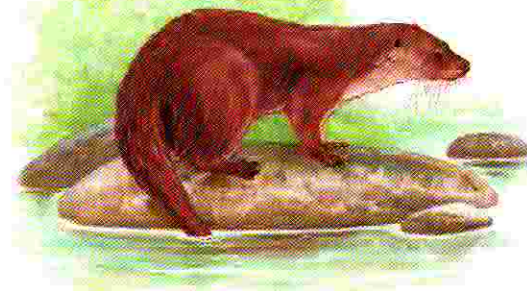
Loutre. Dessin P. R.