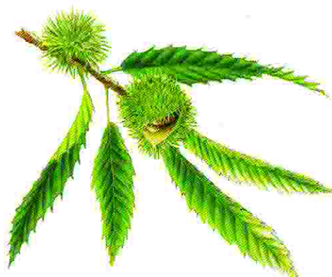
Feuilles et bogues du châtaignier. Dessin N. L.